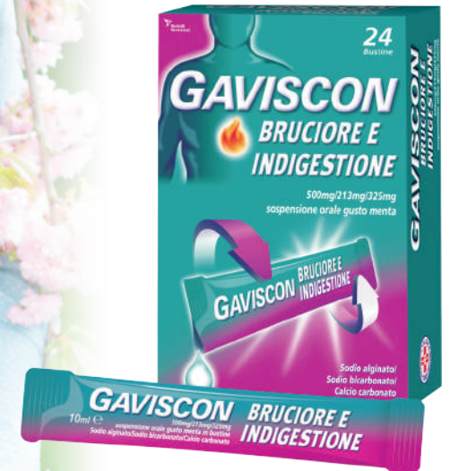
GAVISCON Bruciore e indigestione 24 bustine da 10 ml

Per un rapido sollievo dai sintomi del reflusso, è consigliato l'uso di prodotti che neutralizzano l'acidità e formano una barriera protettiva, pratici da utilizzare ovunque ti trovi.