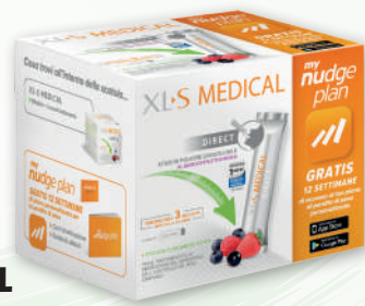
XLS MEDICAL DIRECT 90 sticks

Per mantenerti in forma associa a uno stile di vita attivo e a una sana dieta l'integratore più appropriato a te!