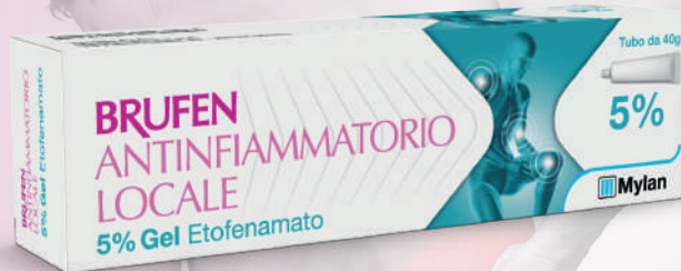
BRUFEN Antinfiammatorio locale 5% Gel, tubo da 40 g

In caso di distorsioni, traumi e dolori articolari chiedi al tuo farmacista il consiglio più adatto.