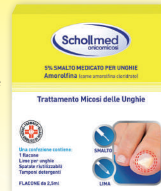
SCHOLLMED Trattamento micosi delle unghie

Le micosi alle unghie devono essere completamente debellate, per questo è necessario l'uso di prodotti che abbiano un principio attivo che agisca attivamente sull'eliminazione del fungo.