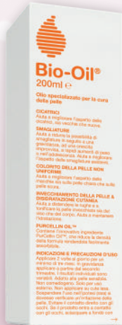
BIO-OIL Olio specializzato per la cura della pelle 200 ml