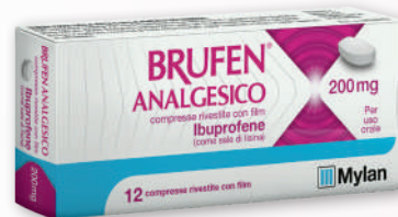
BRUFEN analgesico 12 compresse, 200 mg

In caso di distorsioni, traumi e dolori articolari chiedi al tuo farmacista il consiglio più adatto.