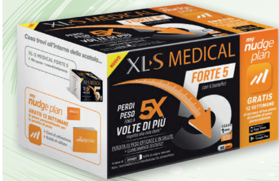
XLS MEDICAL Forte 5 - 180 compresse

Per mantenerti in forma associa a uno stile di vita attivo e a una sana dieta l'integratore più appropriato a te!